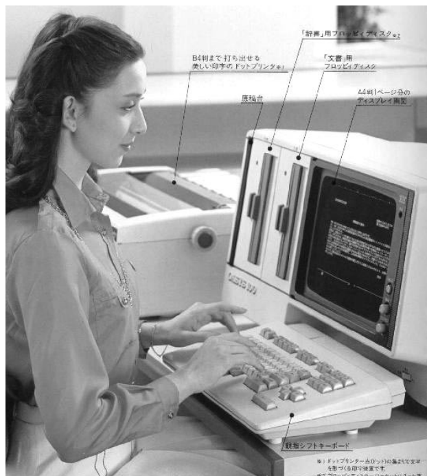
図-3 OASYS 100

うことが分かり、社内に広まっていった。機械の台数も限られていたので、ワープロ使用のために「OASYS 残業」という言葉もできたし、順番待ちのための予約券を発行していた部署もあった。