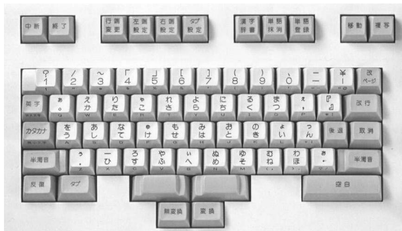
図-2 親指シフトキーボード

1977年7月頃から、英文タイプライタのような使い勝手の日本語のタイプライタができないかと検討を始めた。